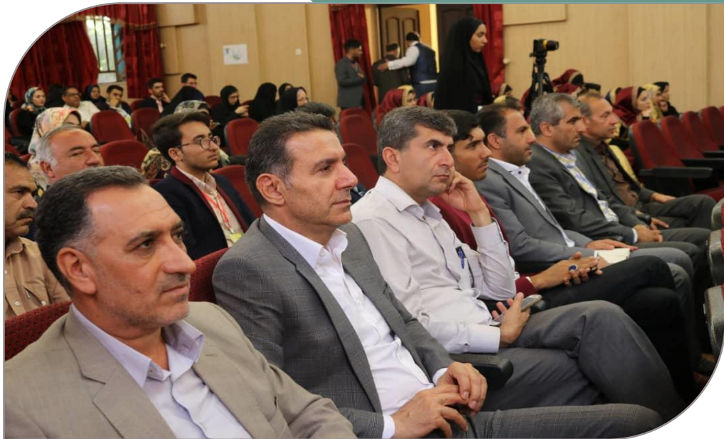
مراسم اختتامیه بیست و نهمین جشنواره فرهنگی تئاتر و سرود