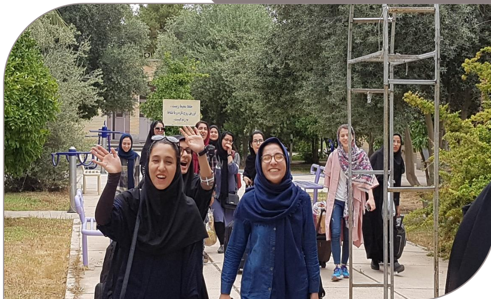
خداحافظی دانشجومعلمیان خواهر با جشنواره ۲۹