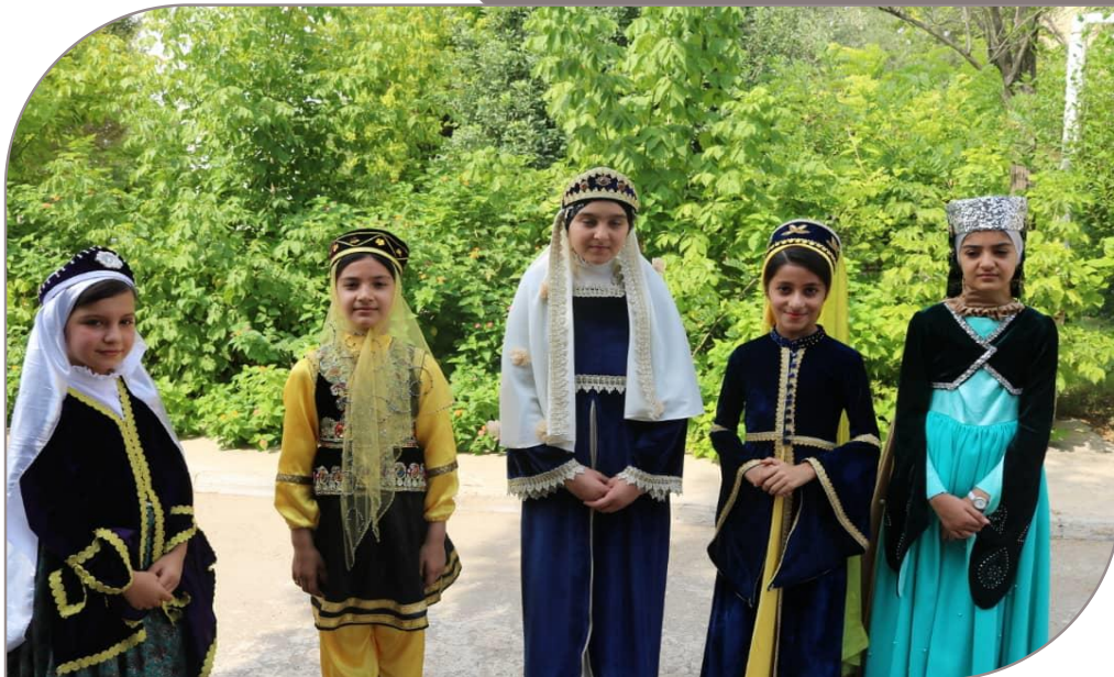
گروه طنز شکر خند از موسسه گل واژه