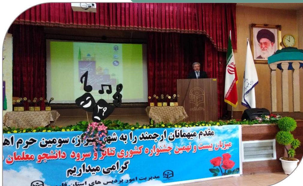
سخنرانی آقای میرمعینی در مراسم اختتامیه