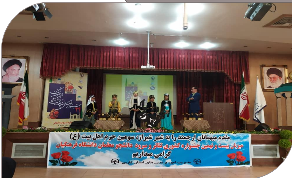
اجرای گروه طنز شکرخند از موسسه گل واژه