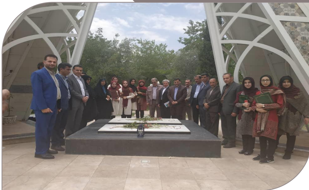
تجدید میثاق با شهدای گمنام پردیس توسط مسئولین و دانشجومعلمیان