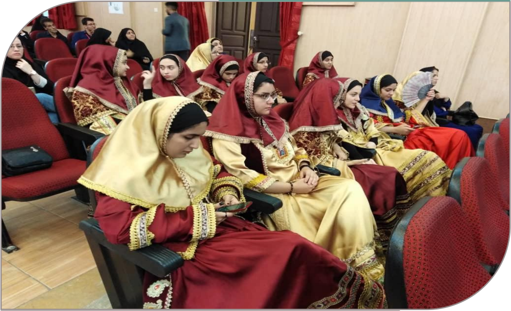
مراسم اختتامیه بیست و نهمین جشنواره فرهنگی تئاتر و سرود