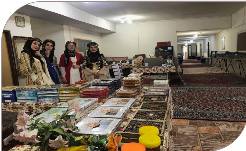
بازدید دانشجویان از غرفه سوغات استان فارس