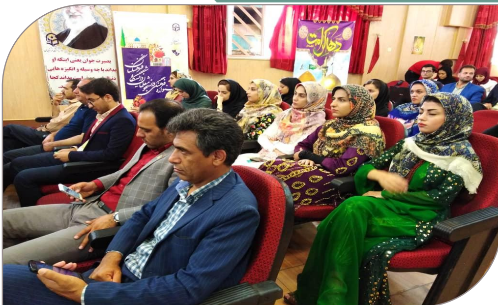
مراسم اختتامیه بیست و نهمین جشنواره فرهنگی تئاتر و سرود