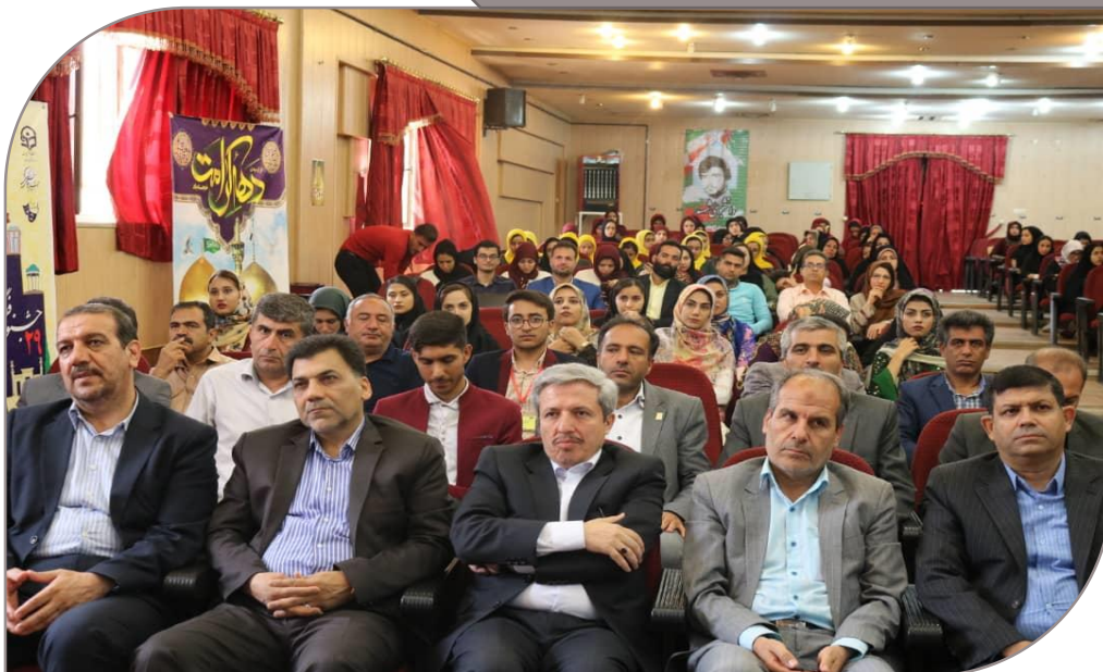
مراسم اختتامیه بیست و نهمین جشنواره فرهنگی تئاتر و سرود