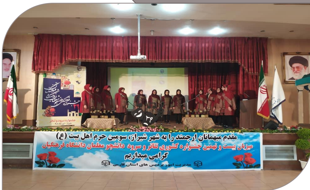
اجرای سرود استان اصفهان در اختتامیه