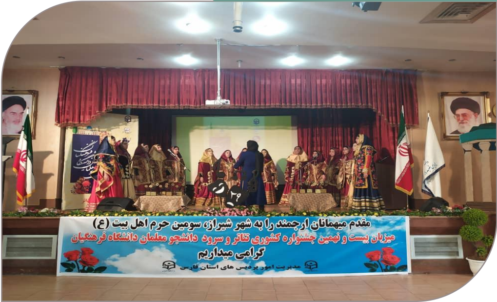
مراسم اختتامیه بیست و نهمین جشنواره فرهنگی تئاتر و سرود