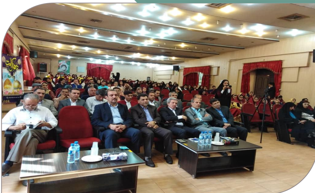
مراسم اختتامیه بیست و نهمین جشنواره فرهنگی تئاتر و سرود