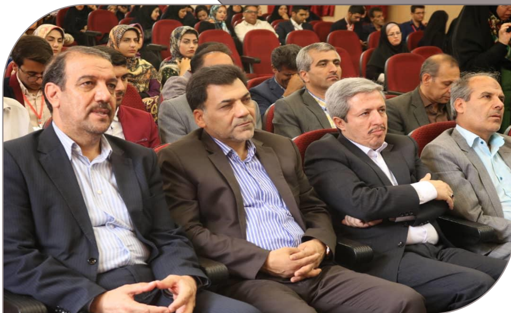
مراسم اختتامیه بیست و نهمین جشنواره فرهنگی تئاتر و سرود