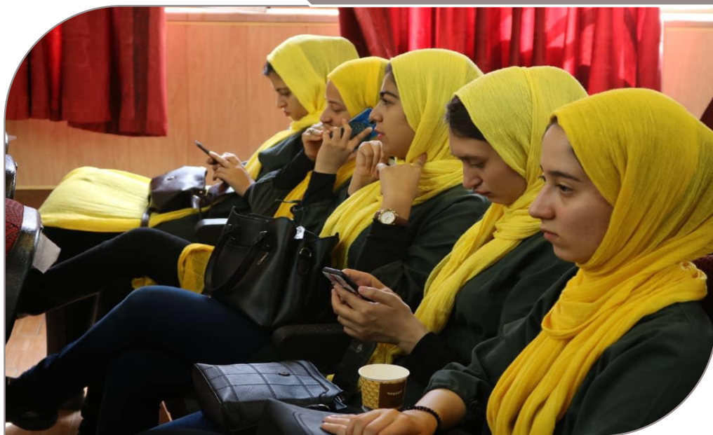
مراسم اختتامیه بیست و نهمین جشنواره فرهنگی تئاتر و سرود