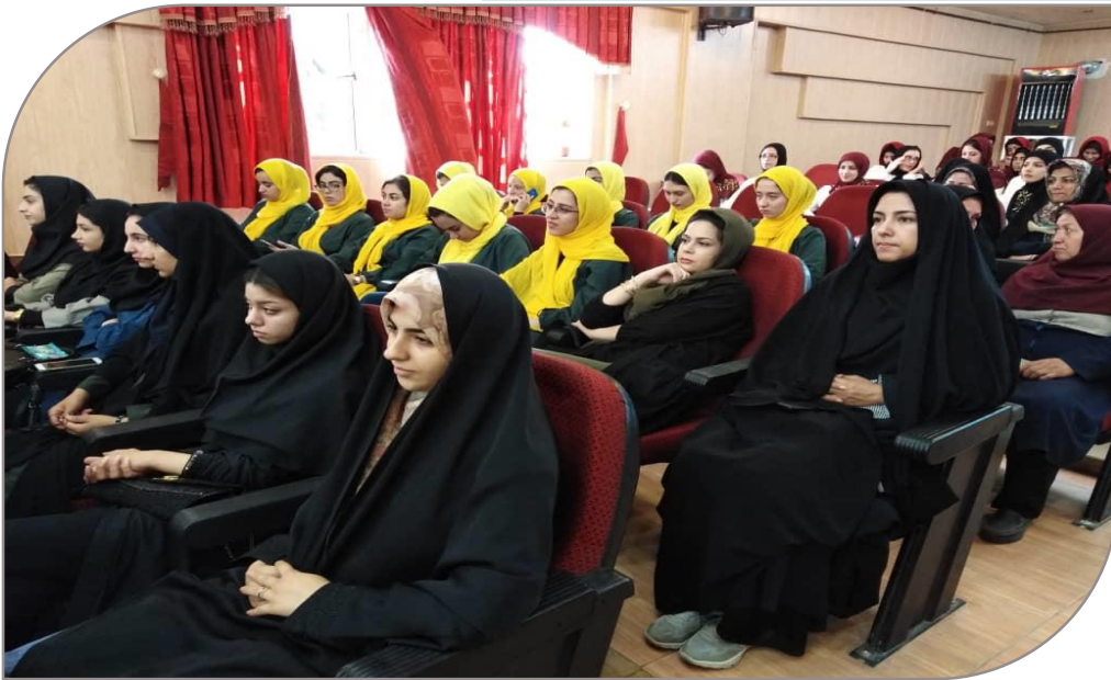
مراسم اختتامیه بیست و نهمین جشنواره فرهنگی تئاتر و سرود