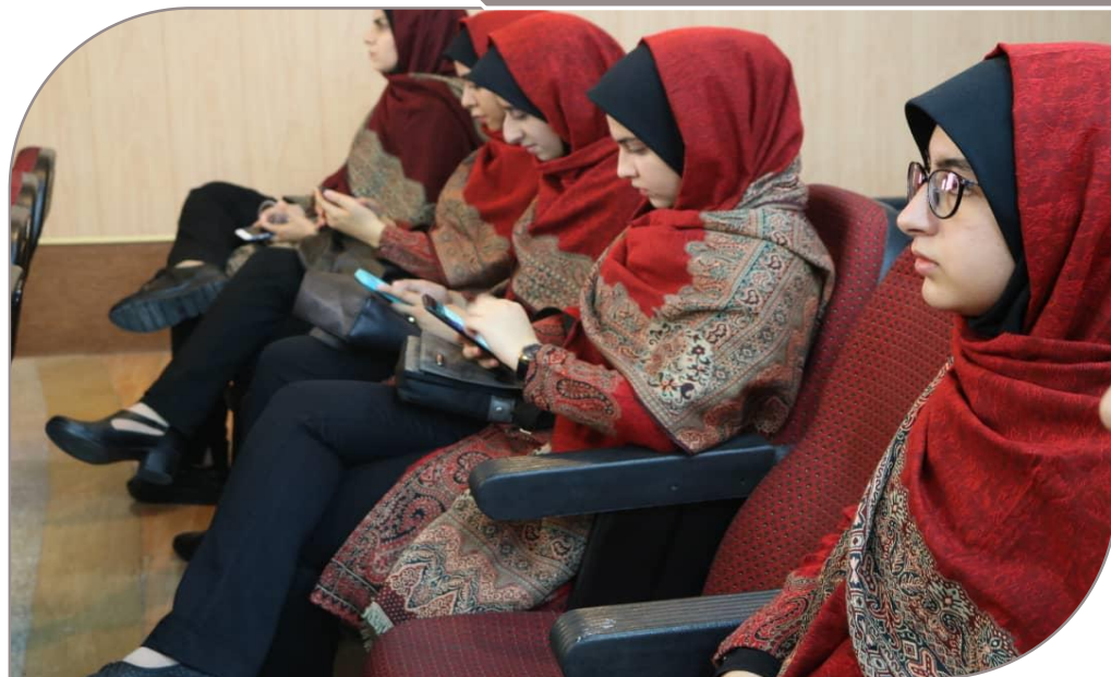
مراسم اختتامیه بیست و نهمین جشنواره فرهنگی تئاتر و سرود