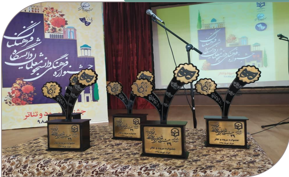
تندیس بیست و نهمین جشنواره فرهنگی تئاتر و سرود