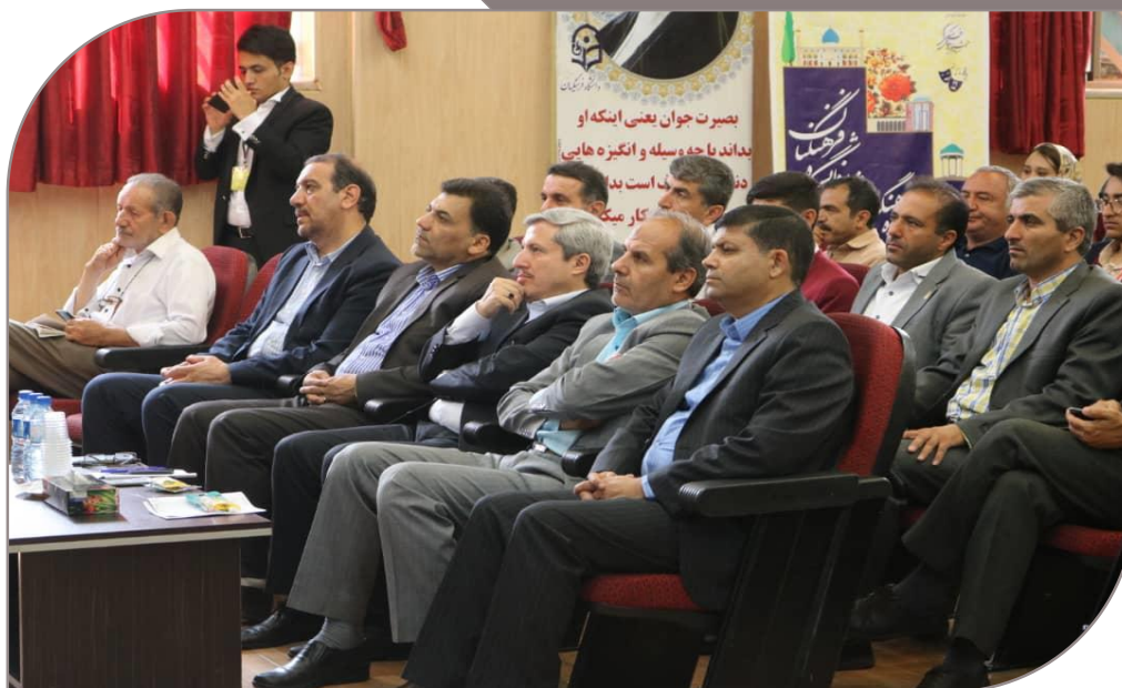
مراسم اختتامیه بیست و نهمین جشنواره فرهنگی تئاتر و سرود