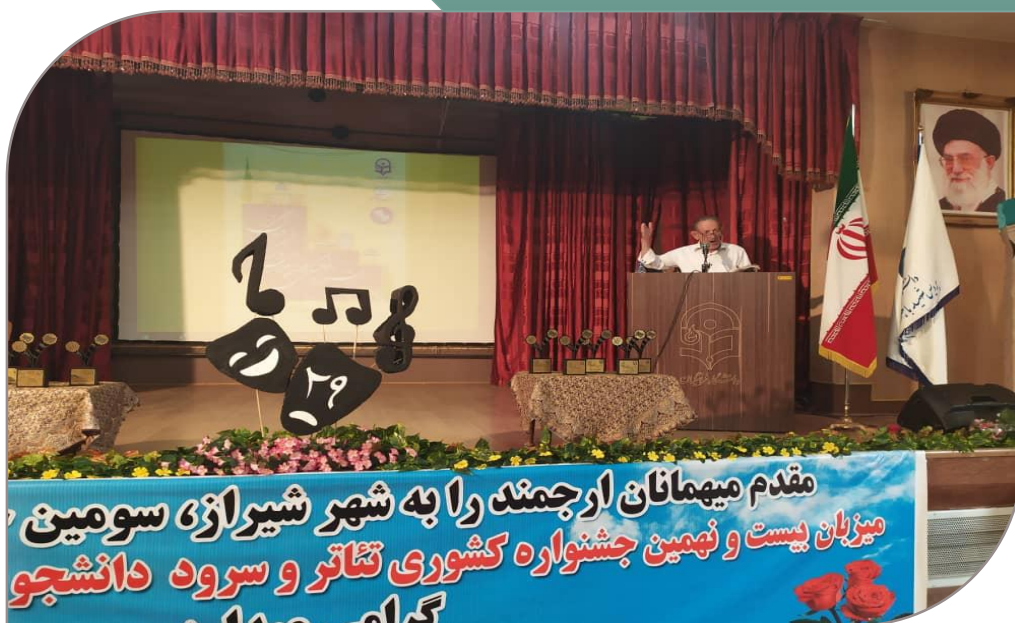
شعر خوانی توسط استاد ده بزرگی شاعر ائینی